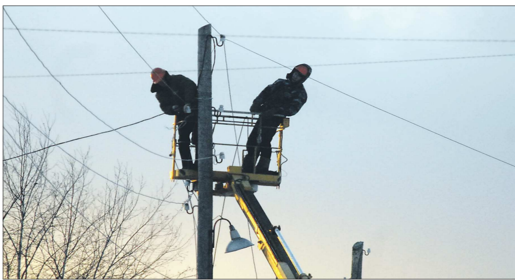
Опыт упрощения процедуры техприсоединения к электросетям будет использован при решении аналогичных проблем в газо- и водоснабжении