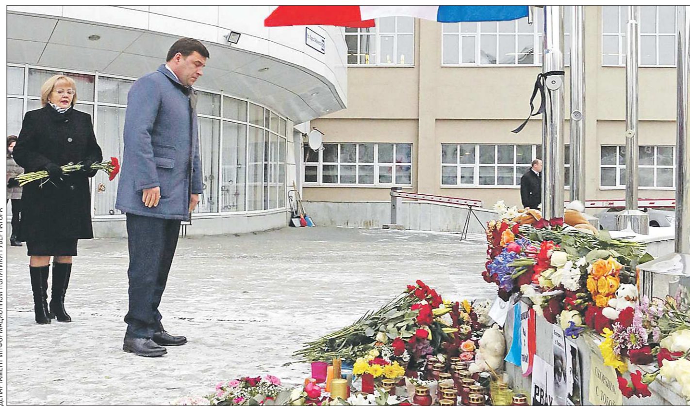
ДЕПАРТАМЕНТ ИНФОРМАЦИОННОЙ ПОЛИТИКИ ГУБЕРНАТОРА

Уральцы выразили солидарность с народом Франции в противостоянии терроризму