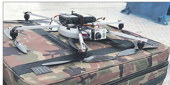
Гексакоптер способен разглядеть лицо человека с высоты 300-500 метров