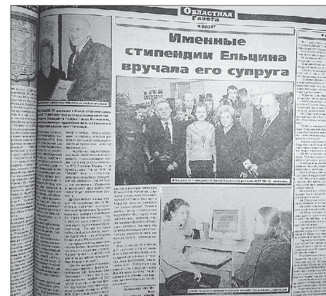
2004 год. На празднование 75-летия строительного факультета УГТУ-УПИ приехала Анна Ельцина: «Супруга первого Президента России открыла именную аудиторию Бориса Ельцина и вручила студентам ельцинские стипендии»