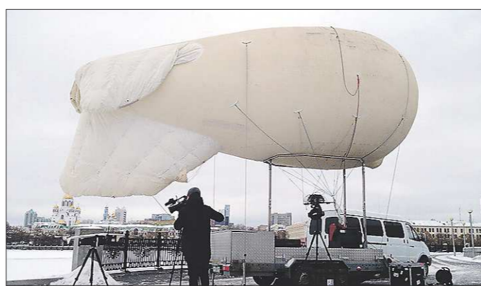
С помощью аэростата «Око-1» однажды был задержан автомобиль, находящийся в федеральном розыске

Белоснежный силуэт аэростата, напоминающего по форме дирижабль, навстречу все жители Екатеринбурга. Аппарат запускают во время проведения массовых мероприятий, ведь с воздуха легче следить за толпой и заметить нарушения общественного порядка. Впрочем, как признаются полицейские, работает аэростат, нарушителей почти не прощадит.