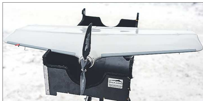
Запускать беспилотники в городе сложно: им нужна взлётная полоса длиной 150 метров

игроков через уравнения и функции и анализируя их, молодому учёному также удалось выяснить, что такой недостаток стратегии наказания, как зависимость от исходной точки (в ней было принято решение), можно преодолеть. Например, если игроки обратятся к стороннему эксперту, который поможет им и дальше в любой временной точке сохранять равновесие. Сравнить это можно с ситуацией, когда два партнёра по бизнесу стремятся к развитию своей компании и получению максимальной прибыли. Но чтобы их решения всегда приводили к наилучшему результату и сегодня, и завтра, и через год, им может понадобиться помощь квалифицированного специалиста.