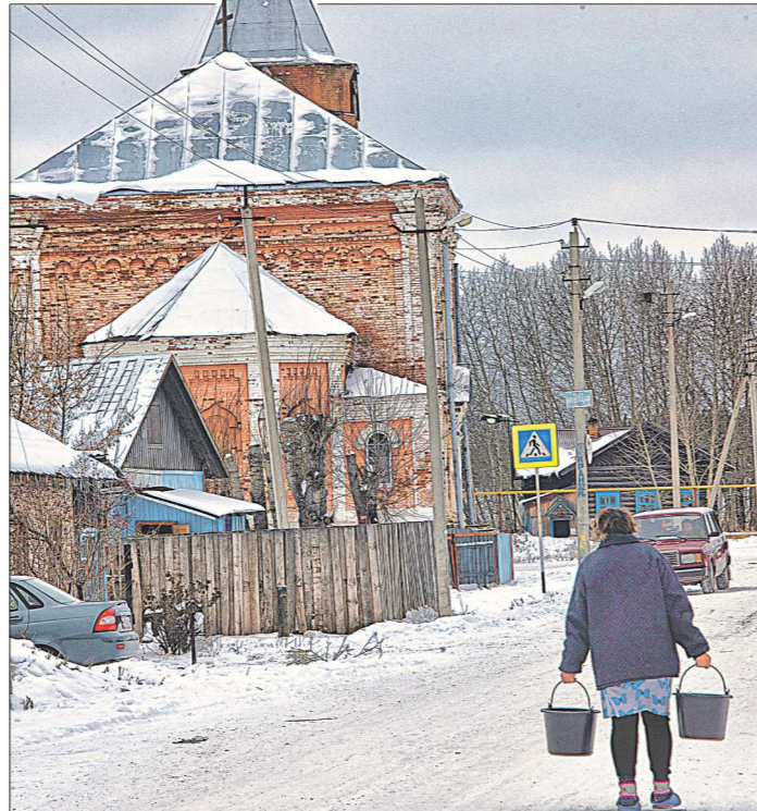
На главной улице Ключей Сысертского ГО – поселковая церковь Спаса Преображения. Её возродили несколько лет назад

На территории находится агрофирма «Ключики», которая выращивает сельхозпродукцию и занимается животноводством, обеспечивая сельчан рабочими местами. Благодаря фермерским хозяйствам и молочной ферме живут ещё одно Ключи – в Алапаевском МО. Ключик, ко-