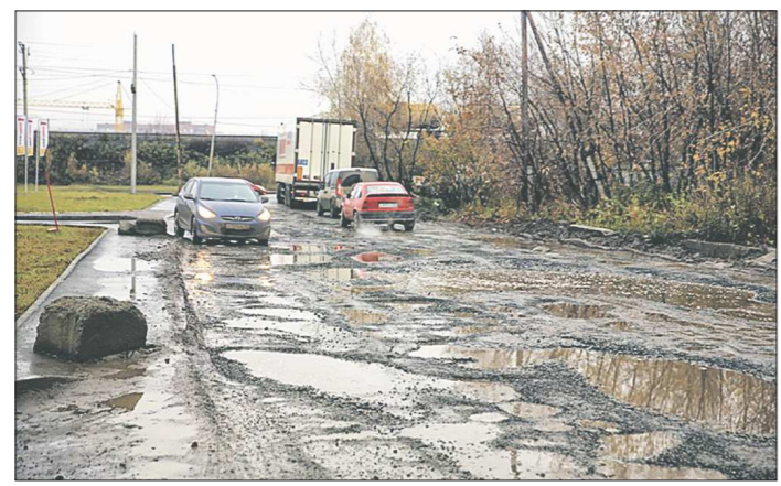
Улица Селькоровская ремонта в этом году так и не дождалась

• В 2015 году муниципальный бюджет выделил на дороги 230 миллионов рублей, которые поделили между 12 объектами. Долгожданная поддержка из областной казны в размере 530 миллионов рублей пришла 17 июля, после чего в Екатеринбурге отремонтировали ещё 21 дорогу – самую крупную пар-