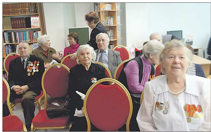
На одной из авторских встреч к 70-летию Победы в библиотеке «Урал»