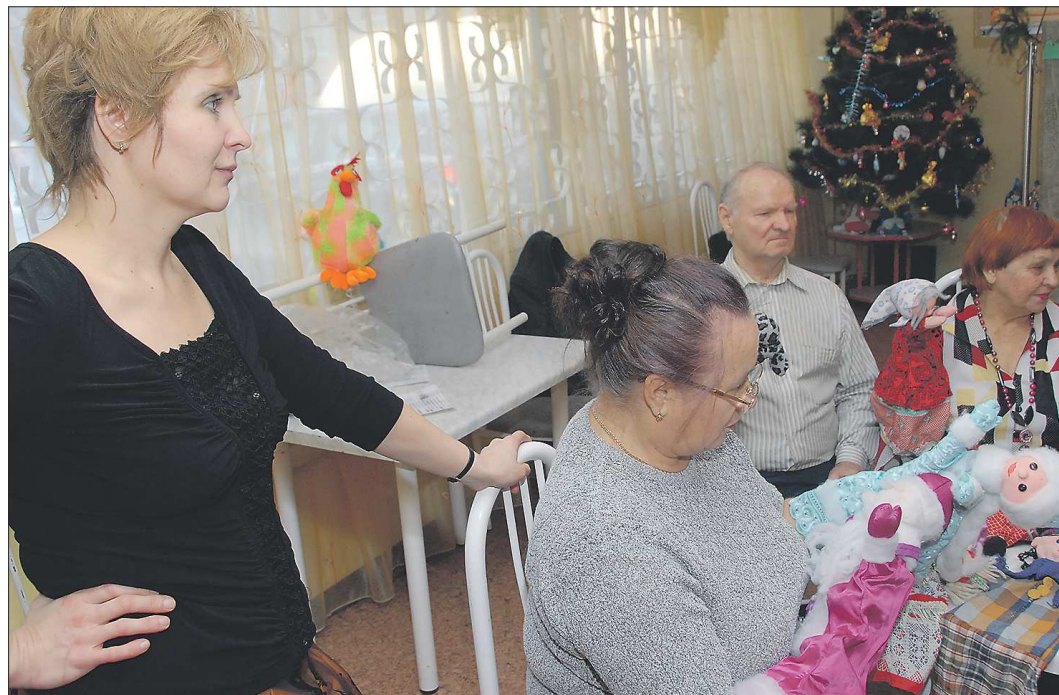
Кукловоды театра «Театрон» КЦСОН Кировского района в Екатеринбурге готовят своих героев к представлению