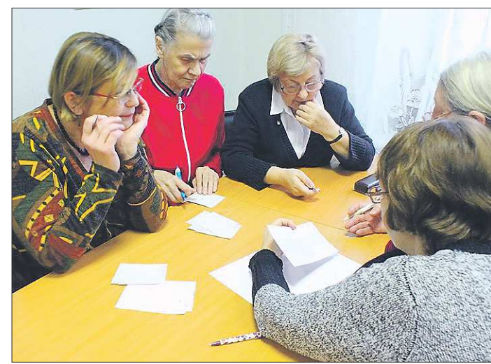
Идёт «мозговой штурм»