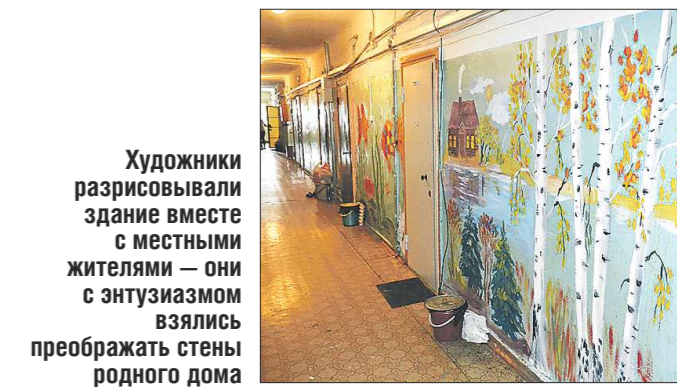
Художники разрисовывали здание вместе с местными жителями — они с энтузиазмом взялись преображать стены родного дома