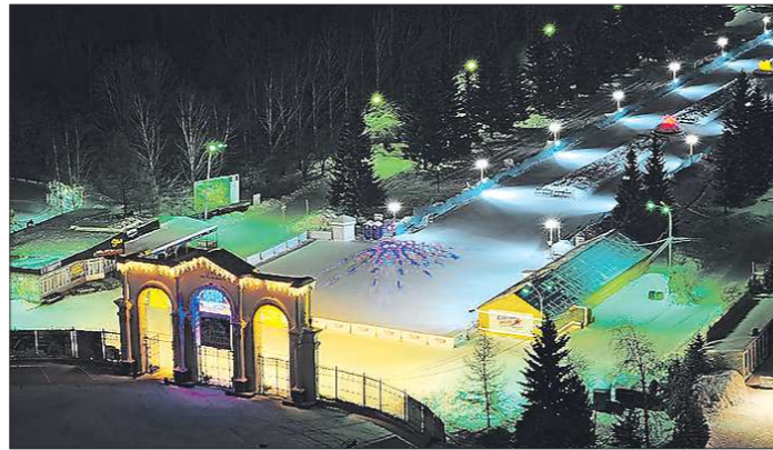
Сейчас у парка нет единой концепции. Новый директор планирует начать работу над её созданием