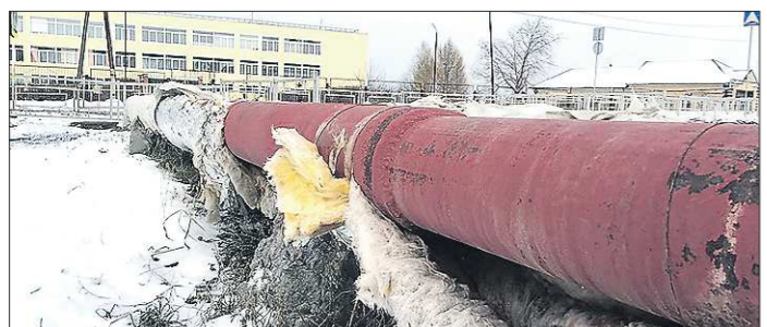
В школе №1 отопление включили, но теплосети так и оставили без изоляции

Напомним, что депутаты Белоярской думы предлагали ввести в муниципалитете режим ЧС, когда с 27 октября без тепла оставались дома на улицах Ключевской, Милейской, Ленина, Юбилейной. Местные власти обещали решить проблему в течение недели, но в срок не уложились, поэтому пришлось вмешаться областному правительству. Кстати, в 2014 году округу выделили 210 миллионов рублей из областного бюджета на модернизацию системы теплоснабжения. Поскольку результатом вложения денег стал срыв отопительного сезона, следовательно завели уголовное дело по факту халатности в действиях сотрудников муниципальной котельной при обеспечении теплоснабжением потребителей Белоярского ГО.