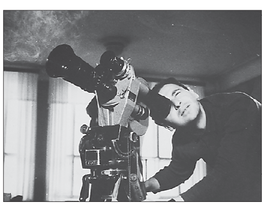
Снимает оператор Евгений Цигель