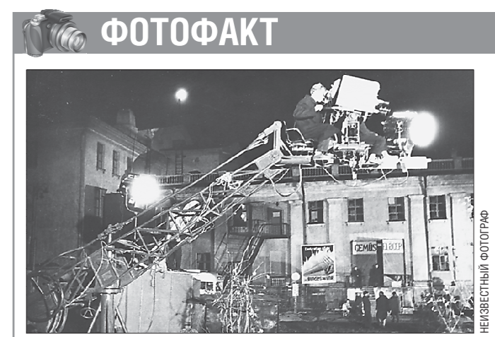
Кинорежиссёр Глеб Панфилов снял в 1964 году короткометражный художественный фильм «Дело Курта Клаузевица». По сюжету, во время войны в освобождённом от немцев посёлке в помещении детского дома находят «Дело» немецкого солдата, который пожалел советских солдат и за это был приговорен к смертной казни. На фото — сцена съёмки фильма во дворе Свердловского телевидения