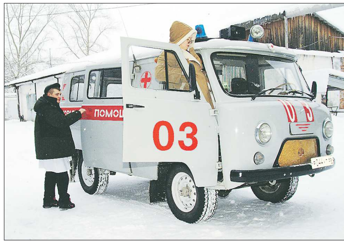
В Алапаевском МР, Краснотурьинском, Новолялинском ГО, Махнёвском МО оптимизация затронула отделения скорой помощи

— Совместными с ОНФ усилиями мы отстояли фельдшерско-акушерский пункт в Нейво-Алапах, сохранили первичную медпомощь в Малом Истоке — отдалённой части Екатеринбург, спасли от закрытия станцию скорой помощи в Лобве. Удалось решить проблему с прикреплением населения ЗАТО Уральский к ЦПК №24 в Екатеринбурге. Увы, за неделю, которая нам даётся на работу в регионе, невозможно успеть объехать все территории, откуда поступают жалобы. У нас на очереди, например, Шалинский район, Кировград. В некоторые муниципалитеты, где мы уже были, хоть возвращай-