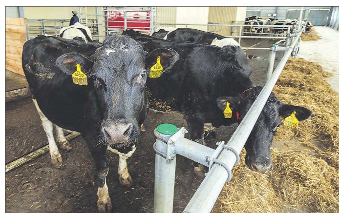
130 коров новой Никитинской фермы будут доить два робота

Роботизированные фермы часто строят из-за нехватки доярок, в колхозе «Урал» цель иная: добиться снижения себестоимости производства молока и благодаря новым технологиям создать пле-