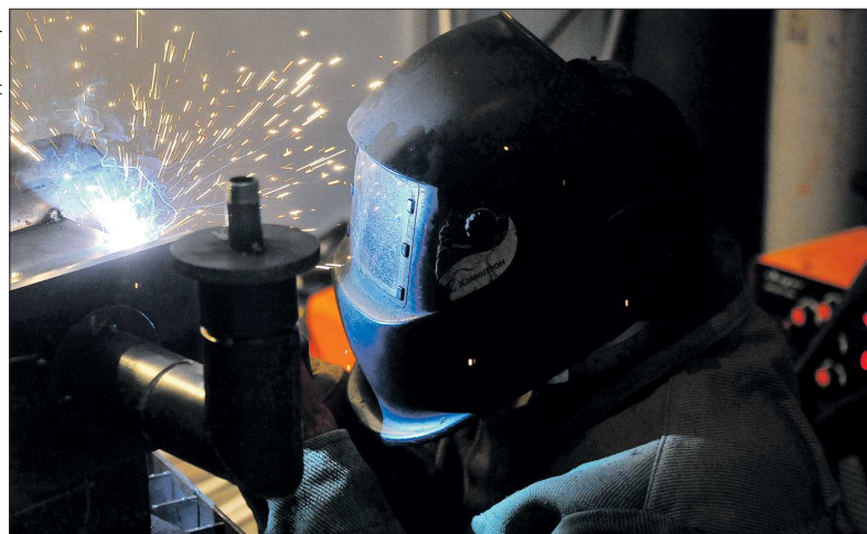
Участвуя в чемпионате WorldSkills Hi-Tech, рабочие повышают свою квалификацию. В этом году в соревнованиях участвует 36 команд