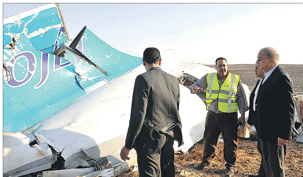
Одним из первых на место трагедии прибыл премьер-министр Египта Шериф Исмаил (справа)