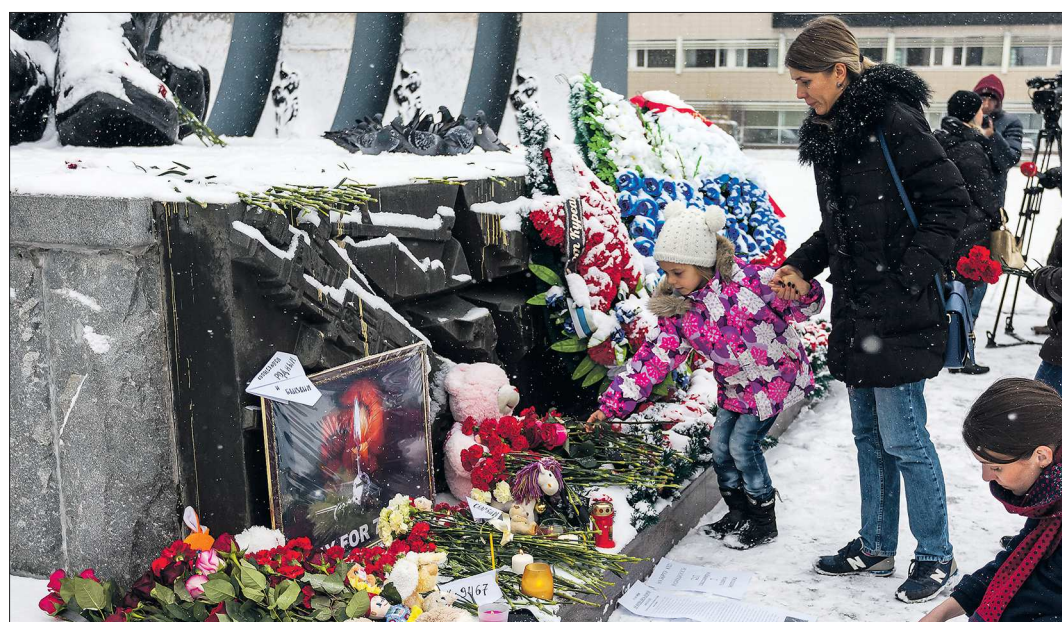
1 ноября у мемориала «Чёрный тюльпан» екатеринбуржцы провели митинг памяти жертв авиакатастрофы в Египте