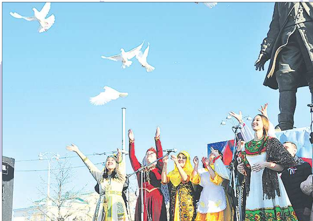
В День народного единства выпускают голубей как символ мира

19:00-23:00 Площадки Екатеринбургского музея ИЗО, Музея памяти воинов-