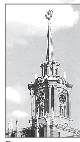
Ремонтировали куранты только однажды — три года назад, в ноябре 2012-го, тогда они стояли в течение двух недель

Эти часы — самые большие на Урале. Диаметр их циферблата — 3,5 метра, длина часовой стрелки — 1,6 метра, а минутной — 1,9 метра. А вот механизм, который двигает стрелки, совсем небольшой, он может поместиться на письменном столе. До 2005 года часы заводили два раза в неделю, для этого приходилось вручную поднимать гири весом более 200 килограммов. Эта операция занимала 15–20 минут. Позднее было закуплено электронное оборудование, и теперь малейшие отклонения стрелок на всех циферблатах корректирует спутник.