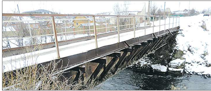
Фундамент моста размывало ежегодными паводками, и теперь одна из опор находится в неудовлетворительном состоянии