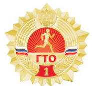
Знак изготавливается из железа. Покрытие металла – имитация золота с полировкой. Размер знака – 24x24 мм, толщина – 1,2 мм

Пока комплекс ГТО сдаётся в тестовом режиме, а с 2017 года он будет работать по всей стране. Важная роль принадлежит послам ГТО – выдающимся спортсменам и общественным деятелям. Виталий Мутко вручил сертификаты послов ГТО девятикратной олимпийской чемпионке по спортивной гимнастике Ларисе Латыниной, двукратному олимпийскому чемпиону по прыжкам в воду Дмитрию Саутину, двукратному призёру Олимпийских игр по фигурному катанию Ирине Слуцкой, а также трём представителям Общероссийского народного фронта.