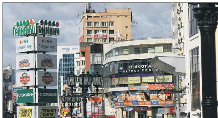
Раньше франчайзеры стремились стать монополистами на территории, сейчас им важно просто присутствие