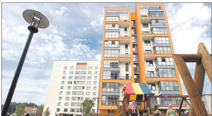
Со своим проектом на Красных Героев компания надеялась выйти в финал конкурса «Строительный Олимп», а победа стала для «Брусники» приятным сюрпризом