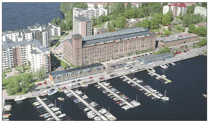
Тампере сами финны именуют промышленной столицей страны

+/- - рост / падение по отношению к предыдущему показателю