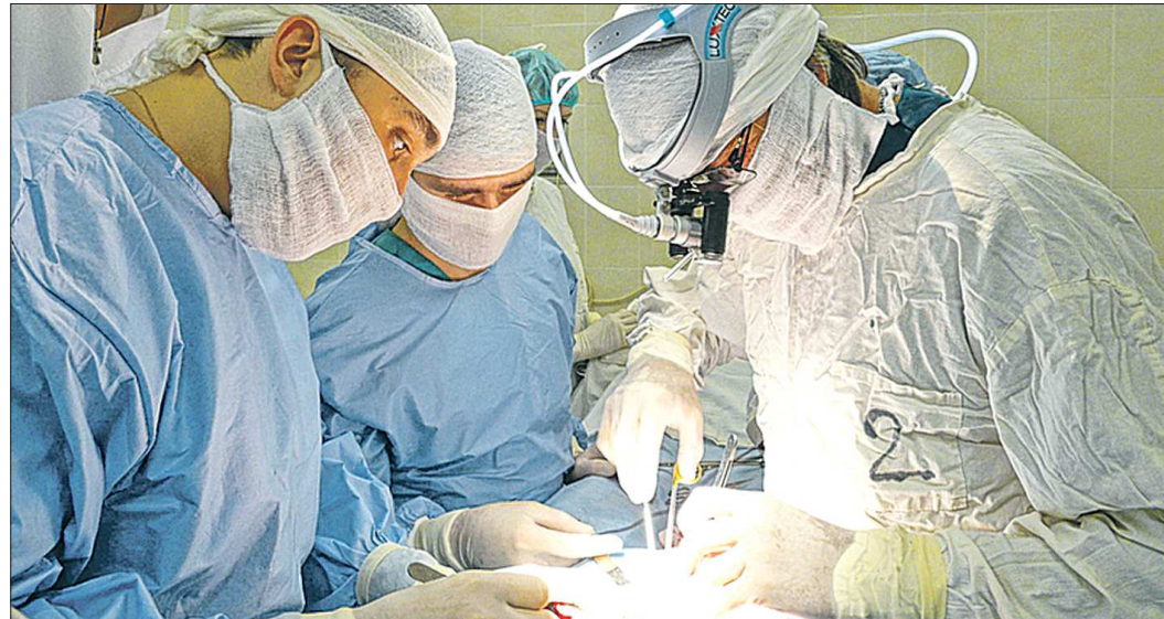
Областная клиническая больница №1 одна из немногих в России занимается пересадкой почки, печени, сердца, костного мозга и роговицы глаза. В 1990 году выполнена первая пересадка почки. С 1997 года внедрена трансплантация костного мозга. С 2005 года выполняются трансплантации печени. А в декабре 2006 года успешно проведена первая трансплантация сердца