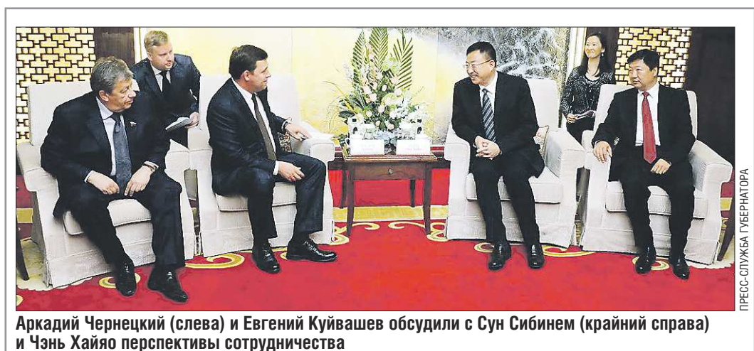
Аркадий Чернецкий (слева) и Евгений Куйвашев обсудили с Сун Сибином (крайний справа) и Чэнь Хайяо перспективы сотрудничества

Исключено, что авторы этих экзотических названий руководствуются стремлением сбить с толку зрителя противника. Но вряд ли это идёт на пользу продвижению на рынках брэндов российского оружия.