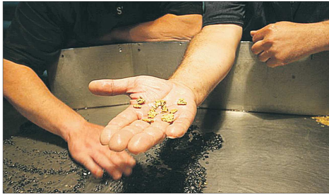
Курсовая стоимость драгметаллов ежедневно меняется, её устанавливает Центробанк РФ. Вчера, 12 октября, один грамм золота стоил 1166,88 рубля, грамм платины – 983,0 рубля, грамм серебра – 15,97 рубля.

– Запасы месторождений, безусловно, сокращаются. Там, где добывают россыпное золото, ситуация сложнее, по рудному золоту она значительно лучше. В Берёзовском можно вести добычу ещё как минимум 50 лет, хотя, конечно, многое будет зависеть от конъюнктуры, цен и общей ситуации в экономике. Около Красноуральска компания «Золото Северного Урала» уже добывает карьер, но это пред-