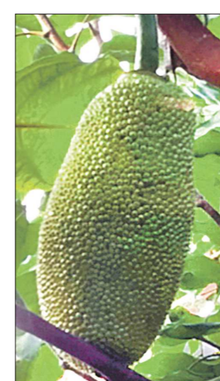
Плод на 40 процентов состоит из углеводов

Точный возраст останков ещё предстоит определить, но навскидку можно сказать, что им от 10 до 50 тысяч лет. Представители УрО РАН уже 40 лет занимаются поиском останков древних животных на Урале, поэтому наш край изучен достаточно хорошо. А вот Приморье остаётся белым пятном – там были проведены только единичные работы отдельных учёных, которые уже устарели. Между тем существуют неплохие перспективы сделать историческое открытие – учёные предполагают, что представители индонезийской фауны и древние обитатели Китая должны были заходить и на территорию современного Приморья, ведь эти земли находятся очень близко.