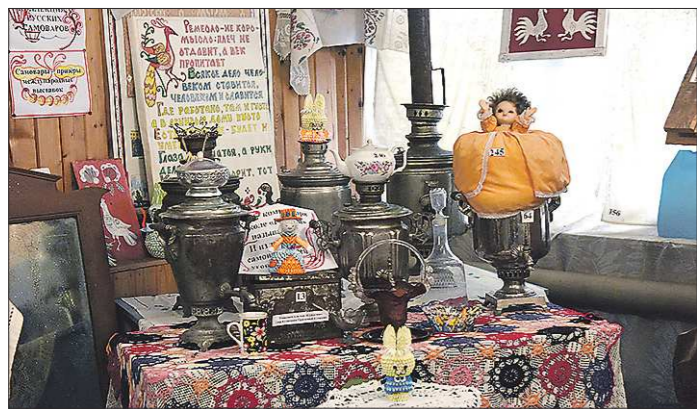
В музее представлены шесть старинных самоваров — раньше этот предмет возглавлял любой стол. Перед праздниками самовары до блеска начищали битым кирпичом