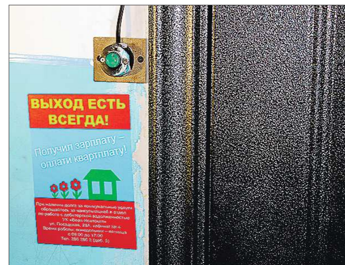
Благодаря таким деликатным наклейкам теперь соседи будут знать, из-за кого с их домом могут возникнуть проблемы