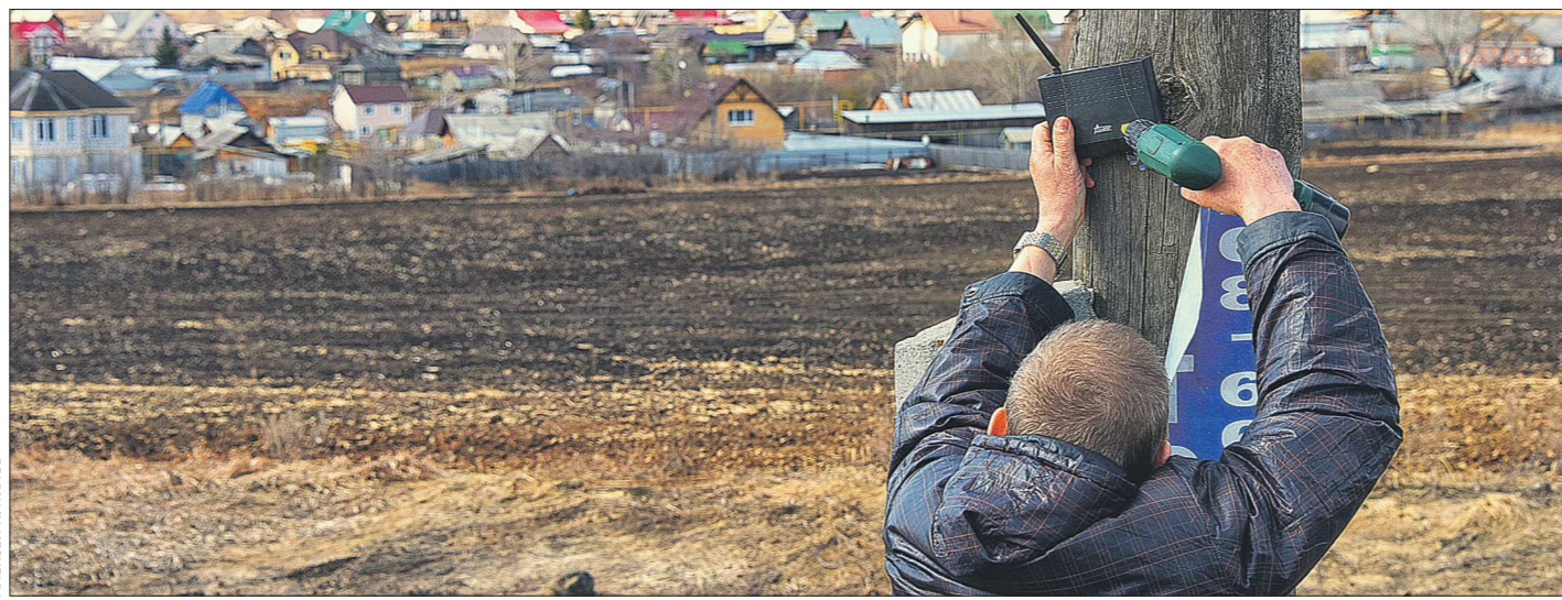
В поселках и деревнях Свердловской области появились новые вышки, раздающие беспроводной Интернет с помощью обычного роутера