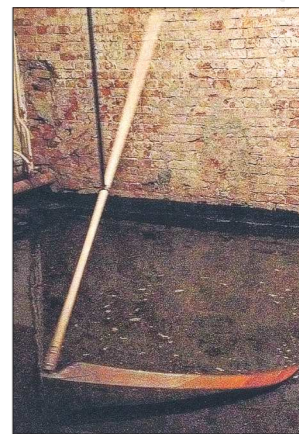
Недавно артинская коса стала... объектом искусства. На III Уральской индустриальной биеннале современного искусства в этом году представлена инсталляция с косой французского скульптора Стефана Тиде. Смотрите видео на oblgazeta.ru

P.S. Подробнее об артинской косе мы расскажем в нашем цикле «Легендарные свердловские бренды» (выходит во вторую и четвертую субботы месяца).