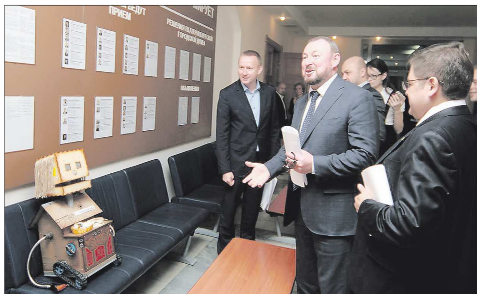
«На «Бал роботов» в Екатеринбург приехал Пушкин»

Накануне в столице Урала открылась международная выставка «Бал роботов», которая знакомит с достижениями робототехники. Первые мероприятия прошло в Москве в 2014 году. Покорив ещё несколько российских городов, «умные» машины приехали и на Урал. Среди гостей с искусственным интеллектом — английский «эмоциональный» гуманоид Теспин, робот-теннисист, механический «Пушкин», обладающий точным портретным сходством с поэтом. Но самый забавный экспонат — робот-попрошайка, которого зовут Деревяшка. Всё, что он умеет — это просить милостыню. Вчера Деревяшка побывал в мэрии Екатеринбурга и получил в свою копилку несколько монет