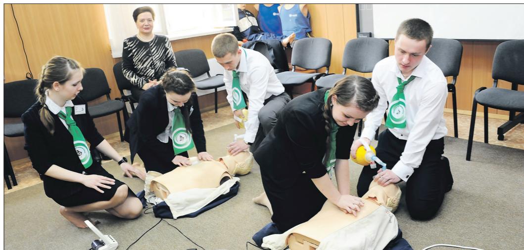
Уроки по оказанию первой помощи есть как в школах на ОБЖ, так и в программе колледжей и университетов