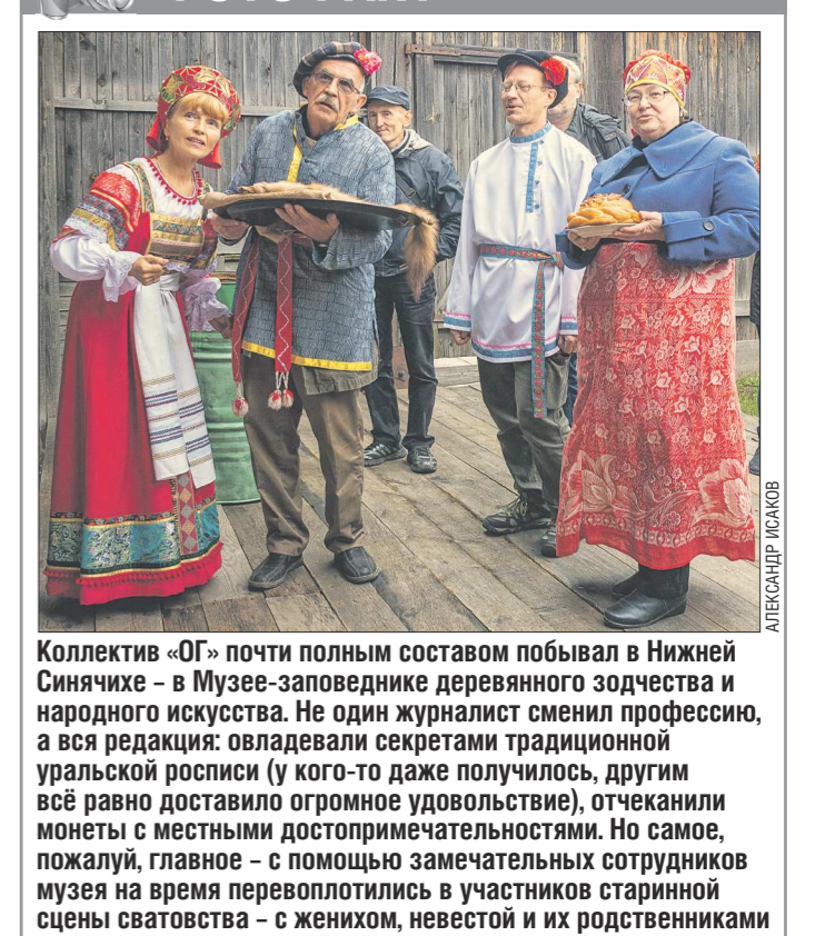
Коллектив «ОГ» почти полным составом побывал в Нижней Сяинчиче – в Музее-заповеднике деревянного зодчества и народного искусства. Не один журналист сменил профессию, а вся редакция овладела секретами традиционной уральской росписи (у кого-то даже получилось, другим всё равно доставило огромное удовольствие), отчеканили монеты с местными достопримечательностями. Но самое, пожалуй, главное – с помощью замечательных сотрудников музея на время перевоплотились в участников старинной сцены сватовства – с женихом, невестой и их родственниками