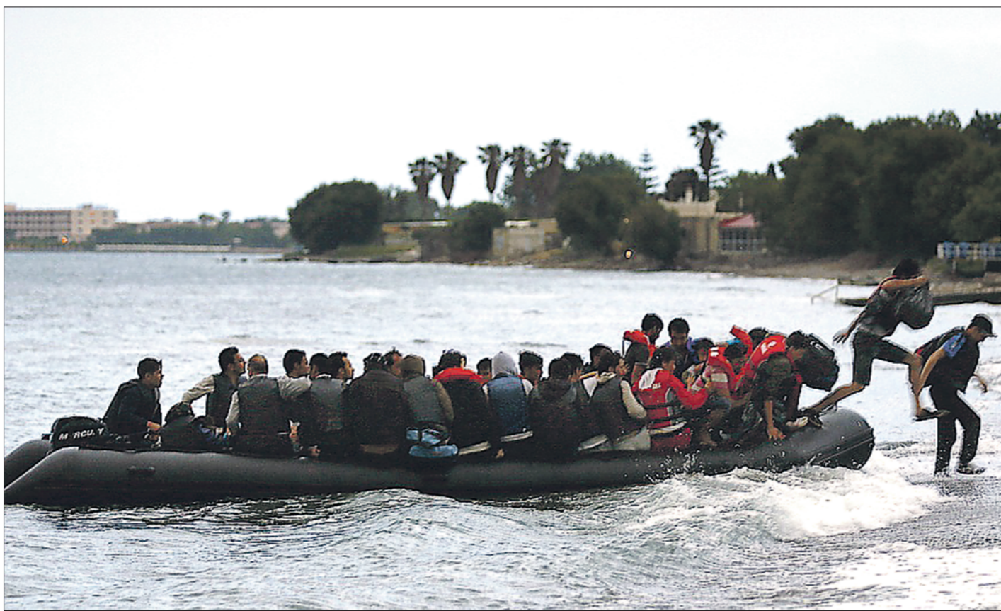
Тысячи беженцев из стран Северной Африки пересекают Средиземное море на теплоходах, баржах и даже надувных лодках. Многие гибнут в морской пучине, но большинству удаётся достичь берегов Италии, откуда они стремятся уехать далее на север — в Германию, Великобританию, Норвегию

Заметим, что если ряд крупнейших государств Европы — Германия, Франция, Италия — сегодня призывают к справедливому распределению мигрантов по всем европейским странам путём квотирования мест для