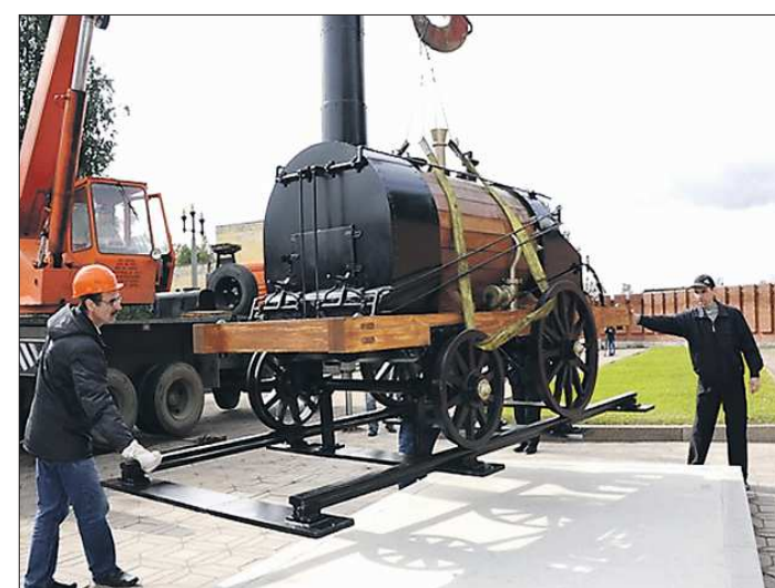
Макет размещён у гостиницы так, чтобы каждый желающий, прогуливаясь по набережной Нижнетагильского пруда, мог не только полюбоваться первым российским паровозом, но и сфотографироваться с ним