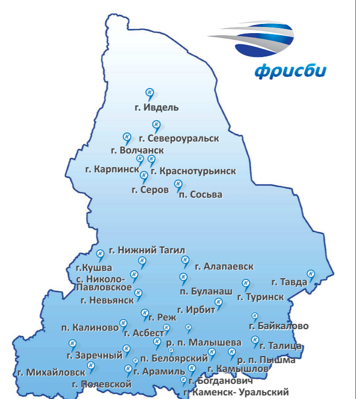
«Фрисби» — приём платежей «с человеческим лицом»

ООО «ЕРЦ — Финансовая логистика» надеется, что многолетний опыт работы в сфере приёма платежей позитивно отразится на развитии системы в Свердловской области и её жители по достоинству оценят новые возможности и преимущества партнёрства. Например, абоненты уже сейчас могут оплачивать услуги онлайн с помощью любой банковской карты на сайте «Фрисби» ( www.frisbee-pay.ru ).