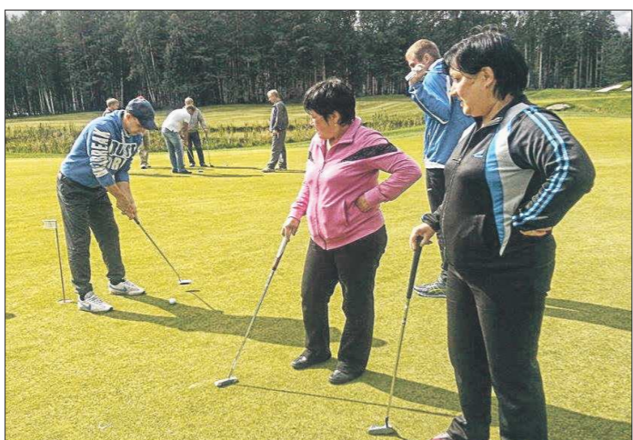
Семинар проходит 40 академических часов. Педагоги обучаются этикету гольфа, методам обучения гольфу учеников разных возрастов, особенностям организации соревнований и тренировочных игр