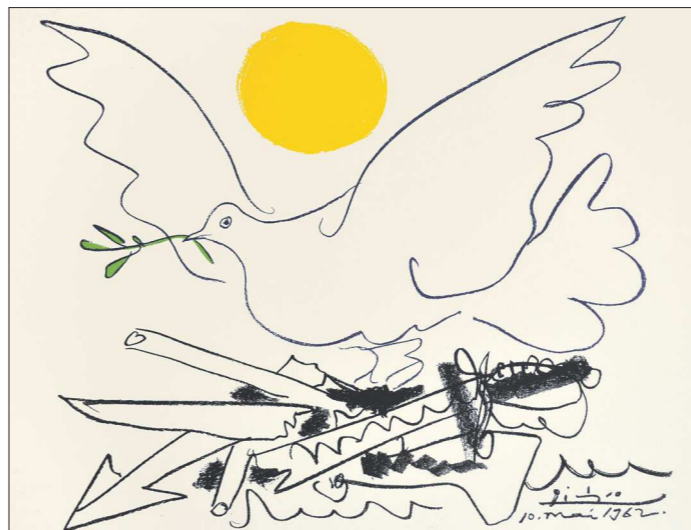
Пабло Пикассо. «Голубь будущего»

Не обошлось на выставке и без знаменитых голубков Пикассо. Это образ белого голубя мира, созданного Пабло Пикассо в 1949 году в качестве эмблемы Всемирного конгресса сторонников мира, проходившего в Париже и Праге. Сначала мастер обратился к довольно реалистичному изображению птицы, а