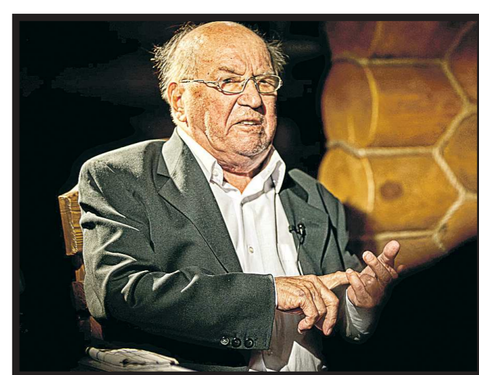
Известный актёр и режиссёр умер после тяжёлой болезни в Москве в возрасте 83 лет

– О, это поразительно! Я читал книги Роулинг, но мы с ней никогда не встречались. Просто удивительное совпадение (смеётся).