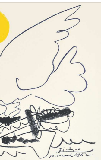
Пабло Пикассо. «Голубь будущего»

фия 1952 года под названием «Голубь будущего», сделанная уже к Конгрессу в Вене. Также на выставке представлен и более поздний вариант на эту тему.