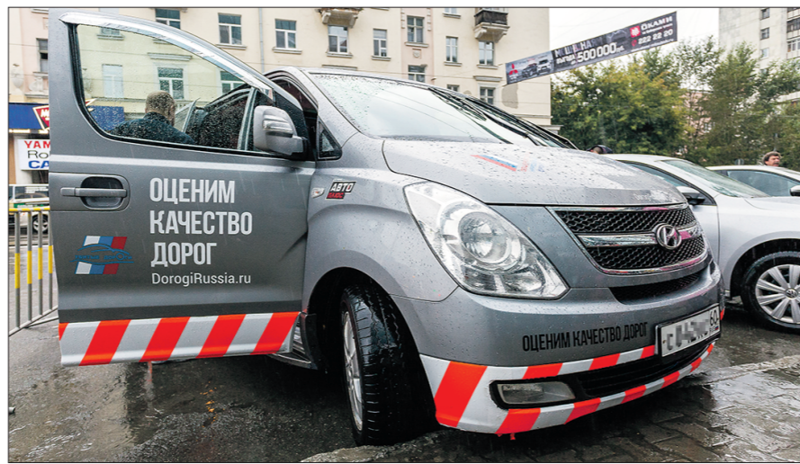
Представители ОНФ приехали в Екатеринбург на своей машине и со своим «самоваром» — бруском-эталоном

На развитие сети центров «Мои документы» из областного бюджета ежегодно выделяется 500 миллионов рублей и ещё 700 миллионов — на содержание.