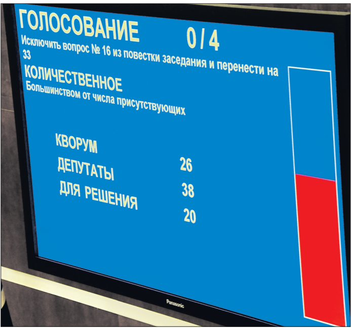
Снимок сделан на заседании Законодательного собрания области 1 апреля 2014 года: из 50 депутатов отсутствуют 12 — почти четверть от списочного состава