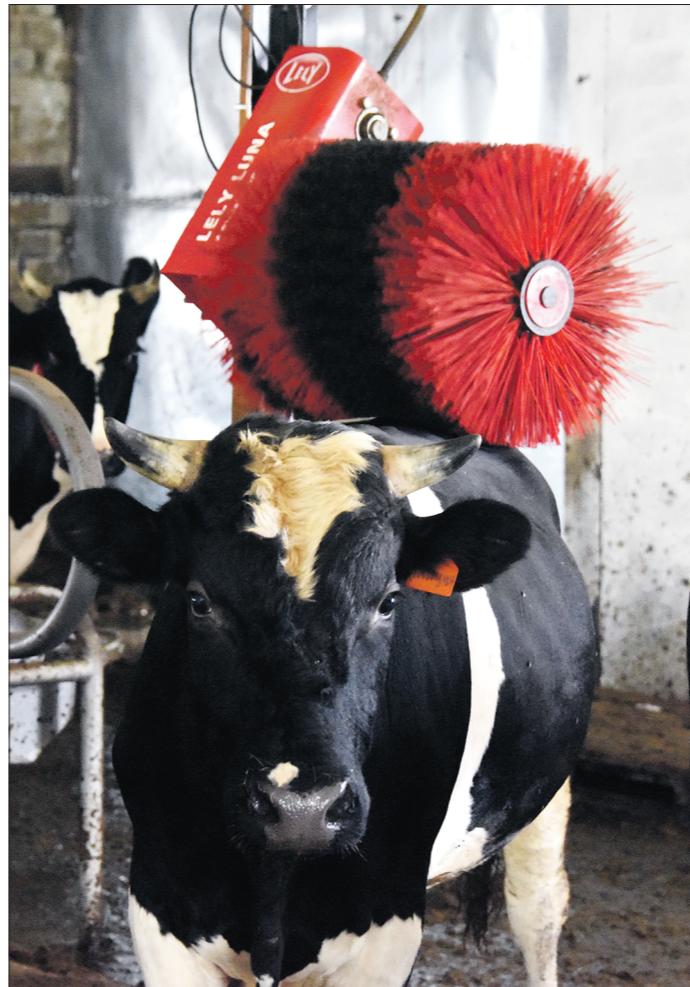
Сегодня коровам чешут бока специальные машины, коровам это нравится, от этого, говорят, тоже идёт прибавка молока