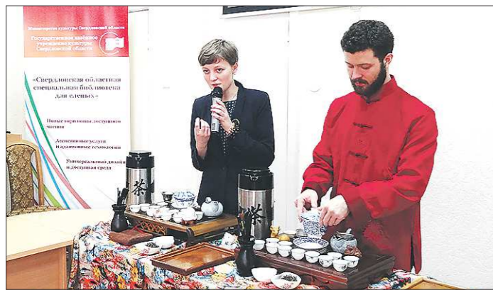
В день открытия в досуговом центре для слепоглохих людей прошла информационно-просветительская программа «Чайные традиции со всего света»