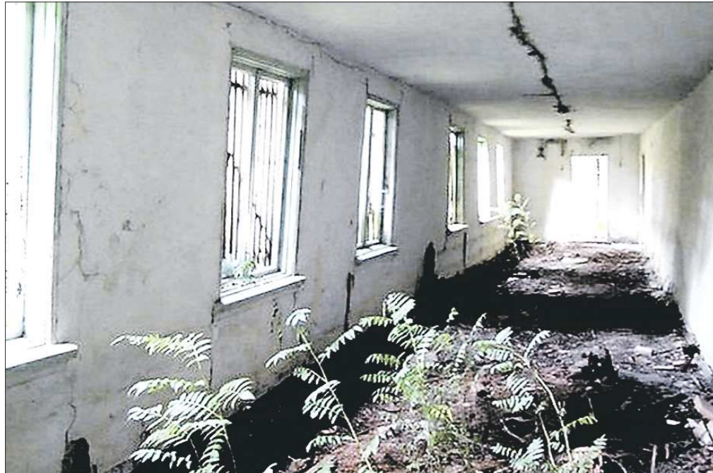
Название не спасло билимбаевский пионерский лагерь «Незабудка» от забвения: вместо ремонта его решили закрыть