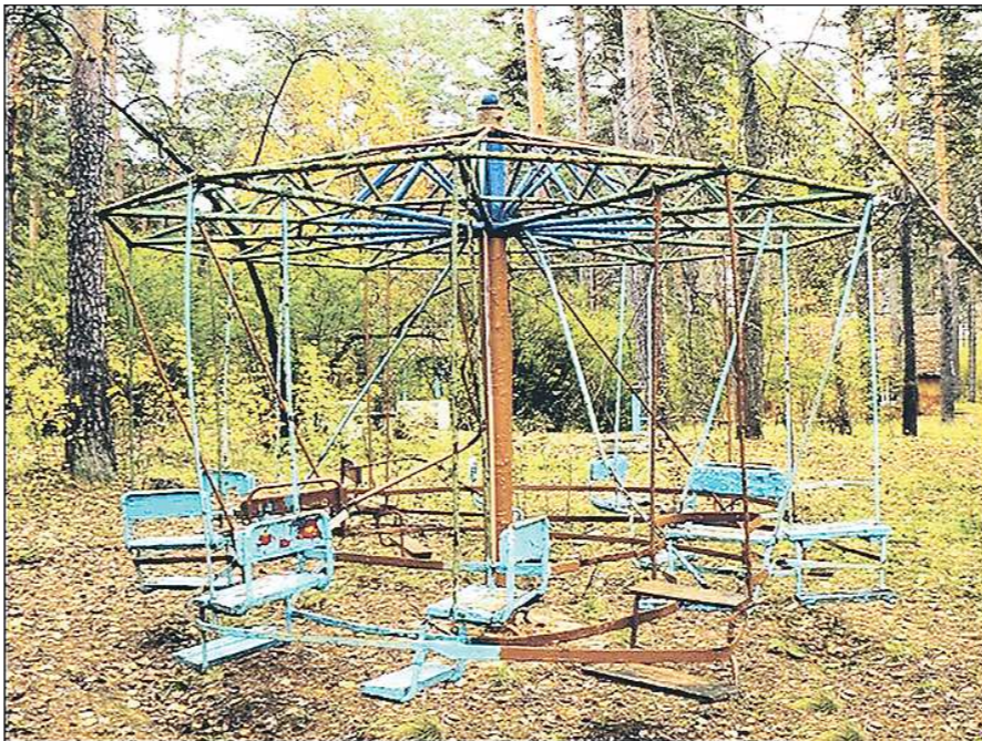
В дегтярском оздоровительном лагере имени Павлика Морозова аттракционы пустыями ещё перед его закрытием: дети предпочитали ездить в современную соседнюю здравницу. Теперь здесь уже некого мотивировать к занятиям спортом