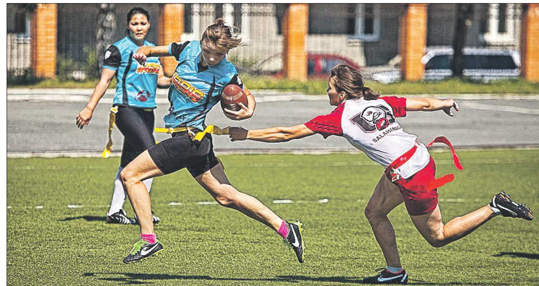
В флаг-футболе, в отличие от футбола американского, запрещено играть в каркасе и шлеме, но разрешены бутсы с резиновыми шипами и обязательны — капты для защиты зубов

— Конечно. Мы, когда придумывали название команды, учитывали американские традиции. У них первое слово часто отражает географию, а второе связано, допустим, с каким-нибудь животным. Оно