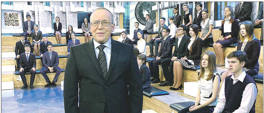
«Умники и умницы» выходят в эфир более 20 лет и являются уникальной для телевидения программой. Более полтысячи юношей и девушек после участия в этой телеолимпиаде стали студентами МГИМО