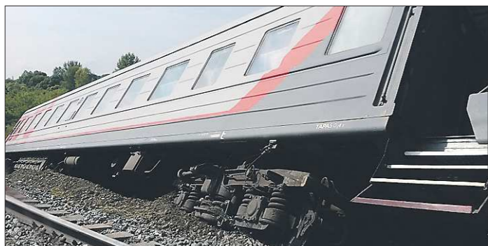
Четыре вагона поезда «Екатеринбург — Адлер» из пятнадцати сошли с рельсов в Мордовии