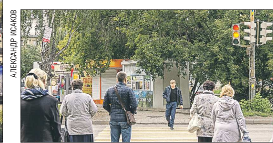
На сегодняшний день в Екатеринбурге установлено 578 светофоров