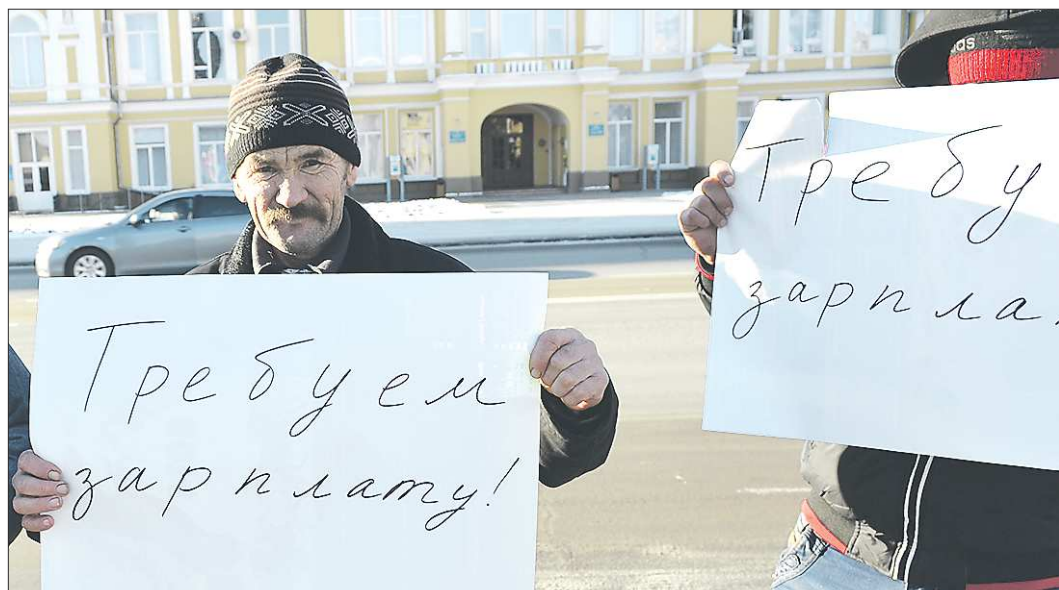
После вступления в силу недавних поправок в федеральный закон у работников появится уверенность, что директор предприятия в любом случае отдаст долги по зарплате: даже если для этого придётся продать его личный коттедж