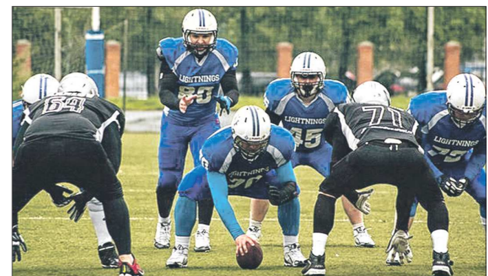
«Молнии» начнут серию плей-офф в статусе лучшей из уральских команд национального чемпионата по американскому футболу

Серия плей-офф стартует матчами четвертьфинального раунда. «Уральские молнии» сойдётся с московскими «Спартакцами», которые заняли третье место в конференции «Волга» – эта игра состоится 8 августа на поле отличной команды. А победитель матча в полуфинале встретится с питерскими «Грифонами». Это второй клуб высшего, премьер-дивизиона, который по своему статусу освобождён от участия в четвертьфинале. Добавим, что екатеринбургская команда уже прибыла в Москву.