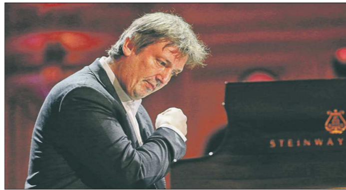
Вообще-то послушать Бориса Березовского, часто приезжающего в Екатеринбург, – это дорогое удовольствие, но во время «Безумных дней» билеты на его концерт будут стоить всего от 500 до 1500 рублей

Фестиваль «Безумные дни» изначально создавался для того, чтобы как можно больше людей в довольно короткий период времени успели насладиться прекрасной музыкой – произведениями классических и современных авторов. Новизна проекта ещё и в том, что рассчитан он в том числе на публику, которая или вообще не ходит в филармонию, или заглядывает