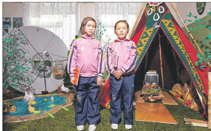
Авторы делали по пять-шесть портретов в день, и каждый раз процессу съёмки предшествовал долгий разговор с героями

Концепция «линии», обозначенная в названии экспозиции, отражена в горизонтальной ориентированности всех