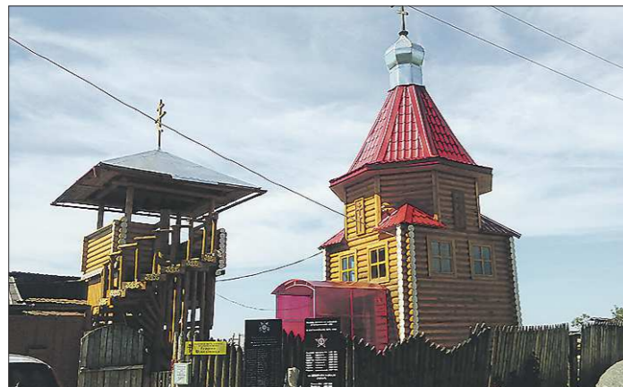
Сруб часовни построили четверо наёмных рабочих. Чаще всего за помощь в возведении храма люди денег не берут

В поселковом храме Успения Пресвятой Богородицы Косте помогли сделать купола и нашли колокола — пять штук. Помогли священнослужители и с проектом часовни — эскизы разработали по примеру уже существующих проектов. Помимо пенсии Коста вкладывается в возведение храма и заработок от продажи баранины: держит в хозяйстве несколько голов, это позволяет сводить концы с концами. Стройка обошлась уже минимум в 80 тысяч рублей, при том, что от сочувствующих граждан поступило немало бесплатной помощи — сельчане помогли украсить стены, принесли ико-