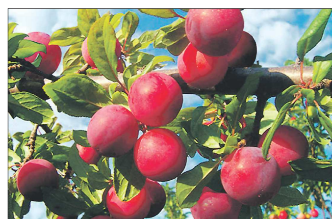
По многочисленным просьбам екатеринбургских садоводов Садовая фирма «Виктория» с 14 по 17 августа в ДК Железнодорожников, ул. Челюскинцев, 102, проводит выставку-продажу саженцев новейших сортов сливы дальневосточной селекции, элитной земляники и других плодово-ягодных культур

Благодаря сдвинутому цветению эти сорта уходят от весенних заморозков, которые обычно бывают в период цветения, и выдерживают сильнейшие морозы в зимний период.