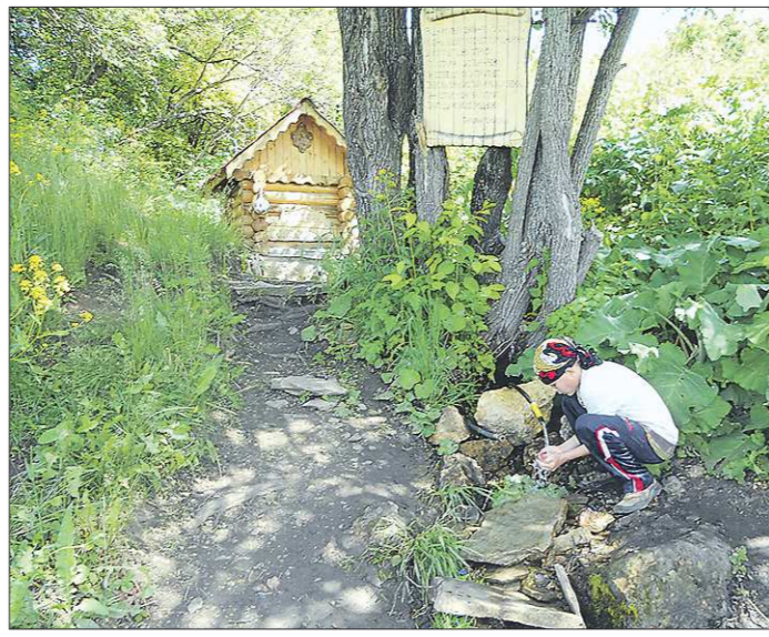
Благоустройством родников часто занимаются школьники, студенты и сотрудники предприятий

— Так что как минимум в течение года после облагораживания из источника пить можно, — заключила депутат. Но далеко не каждый источник проверяется и чистится ежегодно. Если за прилегающей территорией не