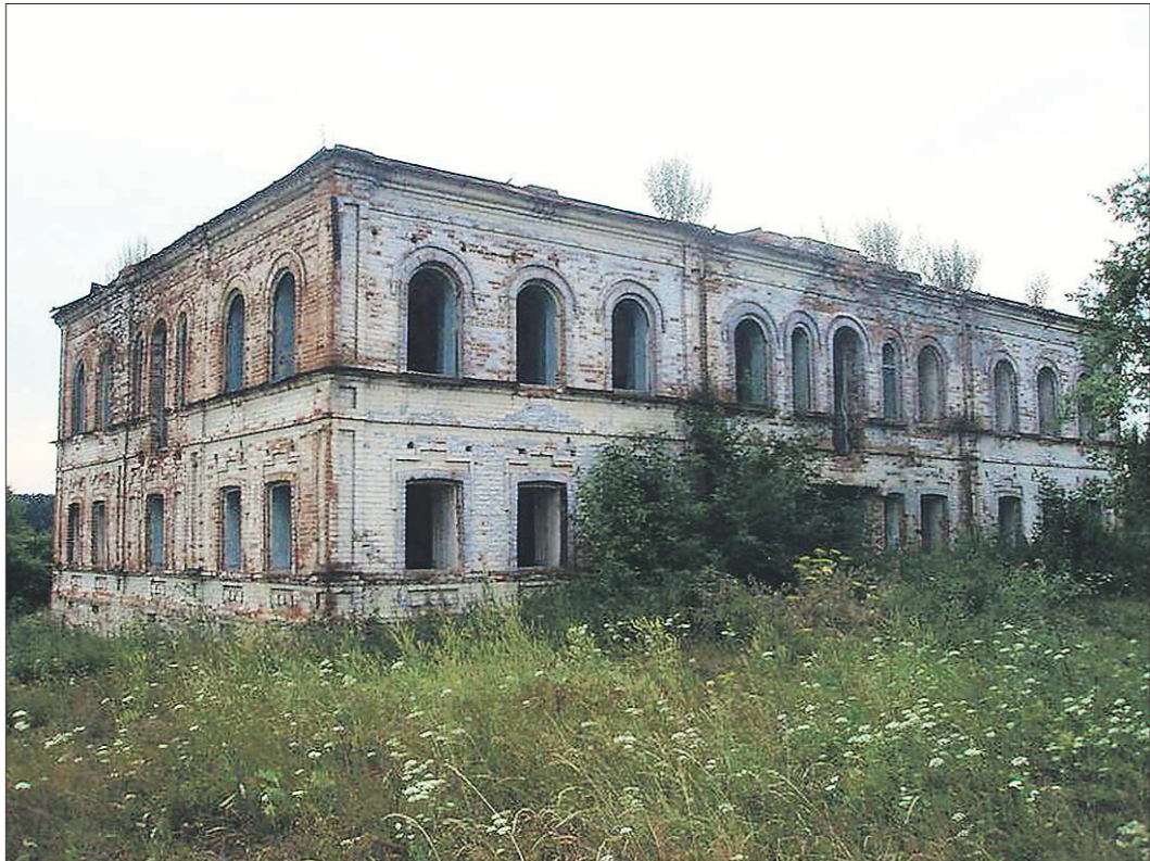
Башкарская школа (Горноуральский городской округ) переехала из исторического здания 36 лет назад: новых хозяев особняк так и не нашёл

Не осталось без дела и четырёхэтажное здание бывшей школы в Староуральске: сейчас там располагаются библиотека, музей, архив, единая дежурно-диспетчерская