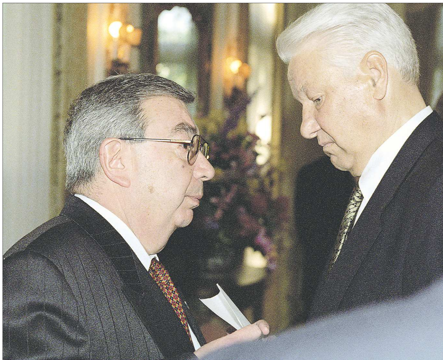
В 1998 году после отставки Сергея Кириенко Борис Ельцин (справа) сперва предложил назначить на пост премьер-министра Виктора Черномырдина, но депутаты на это не согласились, и тогда президент внёс кандидатуру Евгения Примакова

После отставки правительства Кириенко в результате дефолта началась эпопея с назначением нового премьер-министра. Президент предложил кандидатуру Виктора Степановича Черномырдина. Члены правительства активно работали с депутатами Государственной думы, пытаясь убедить их поддержать эту кандидатуру. Евгений Максимович, которому суждено было через месяц стать председателем