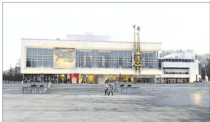
Реконструированный екатеринбургский Театр юного зрителя одним из первых заявлен на участие в конкурсе «Строительный Олимп» в категории «Социальные объекты»

+/- — рост / падение по отношению к предыдущему показателю