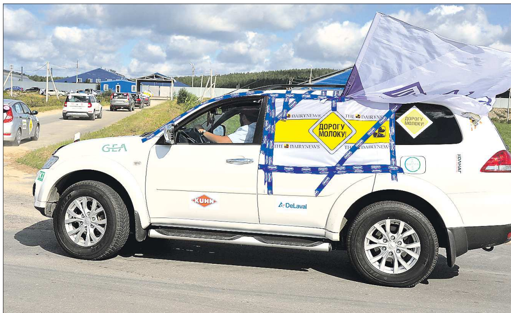
За четыре дня 43 экипажа участников автопробега проедут 1 700 километров, посетят полтора десятка молзаводов и хозяйств

За последние 14 лет производство молока в мире выросло на 40 процентов, в России же упало на 5 процентов — такие данные привёл главный редактор информацион-