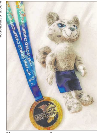
Награда за победу в технической программе: девятая медаль чемпионов мира и Снежный барс – талисман соревнований