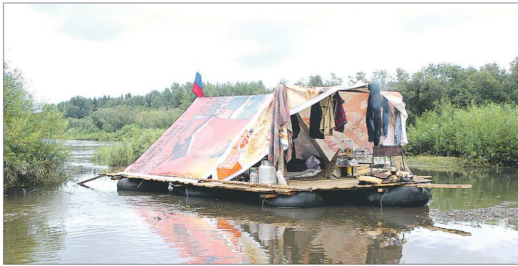
Необычный транспорт шамарцы выбрали в соответствии с конечной точкой своего маршрута, которая входит в Молёбскую аномальную зону

Записали Ольга КОШКИНА, Галина СОКОЛОВА, Елизавета МУРАШОВА