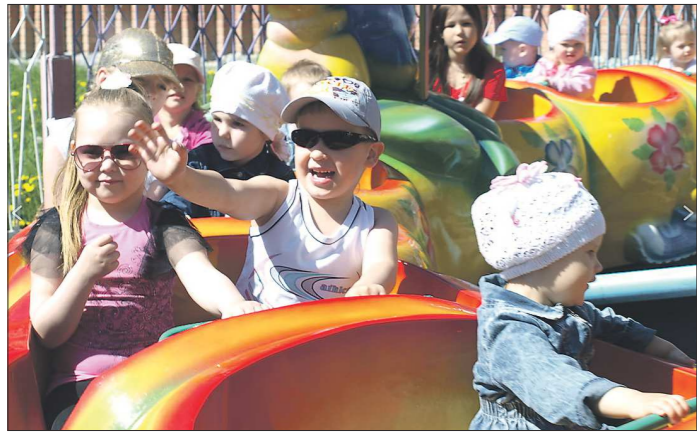
За полгода парк в Лесном принял 30 тысяч посетителей — к 2017 году его намерены сделать ещё популярнее