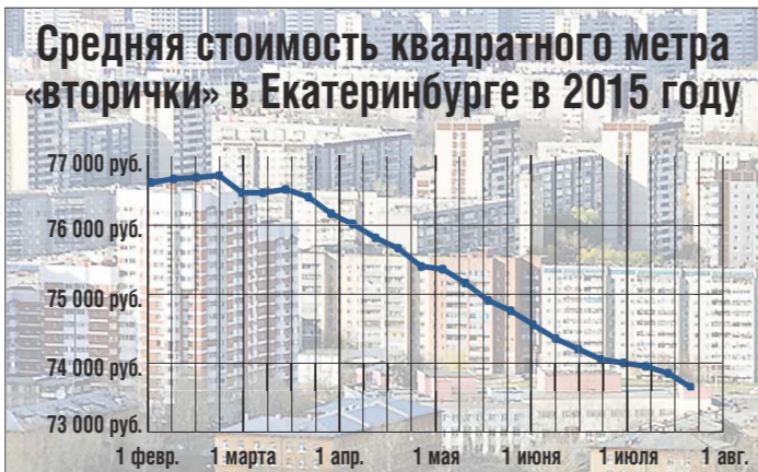
По данным Уральской палаты недвижимости, стоимость жилья в Екатеринбурге постепенно снижается. А вот разброс цен при всех колебаниях рынка остаётся одинаковым

По данным Уральской палаты недвижимости, за полгода стоимость вторичного жилья в Екатеринбурге снизилась на три процента и продолжает уменьшаться. А вот ценовой разрыв между самым бюджетным и самым элитным жильём остаётся неизменным. «ОГ» сравнила два полюса жилищного рынка в уральской столице.