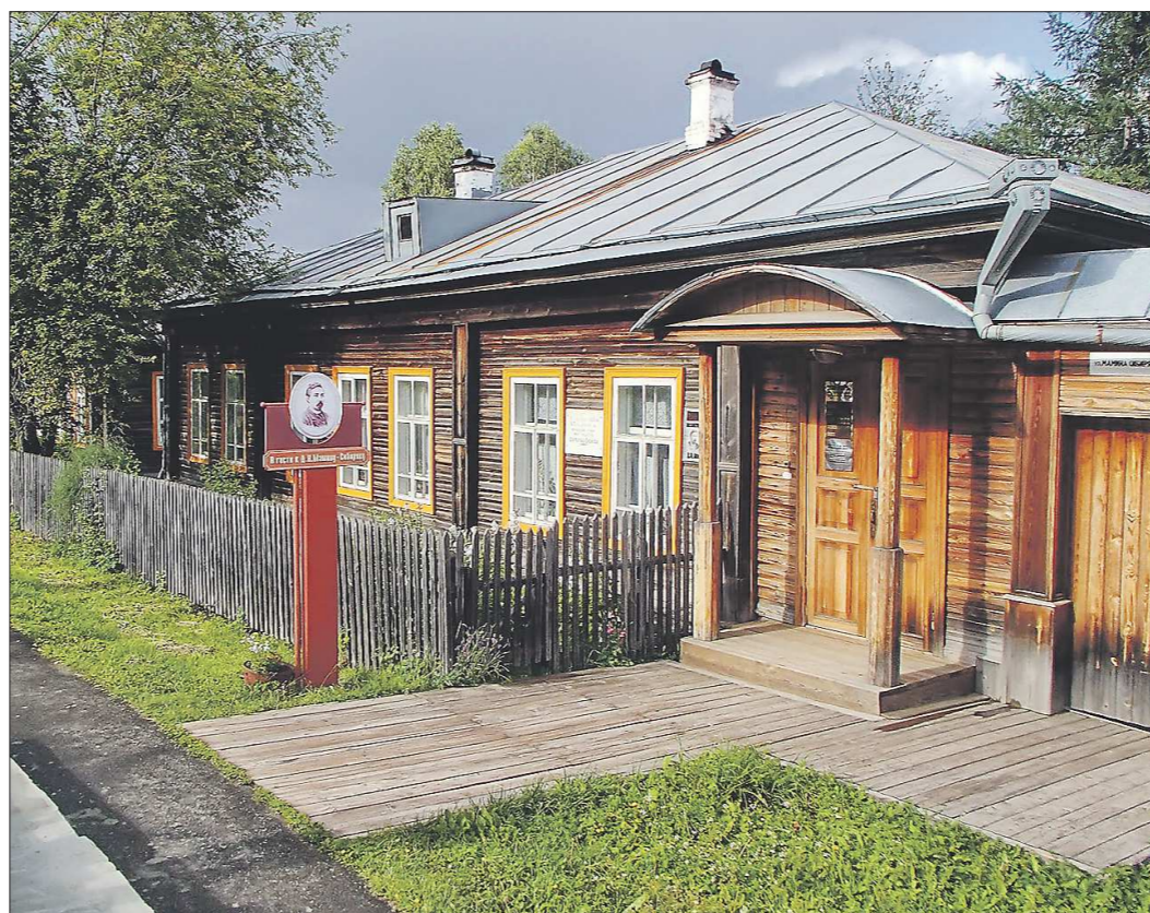
Дом-музей Д.Н. Мамин-Сибиряка — одна из главных достопримечательностей Висима: во время «Прямой линии» с Президентом местные школьники даже пригласили сюда Владимира Путина