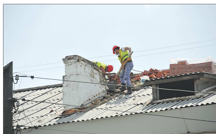
В этом году планируется капитально отремонтировать 961 дом по всей Свердловской области