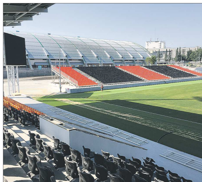
«СКБ-Банк Арена», которая вмещает 10 000 зрителей, стала первым из готовых объектов чемпионата мира-2018 в России

ной выставки Иннопром-2015, прошедшей в Екатеринбурге в первой половине июля, обсуждалось формирование территории опережающего развития в «атомных» городах региона — Новоуральске и Лесном. Как пояснил первый вице-премьер — министр инвестиций и развития Алексей Орлов, ведущее место в промышленном производстве этих городов занимают предприятия госкорпорации «Росатом». Это наукоемкие предприятия, использующие современные технологии, имеющие мощный научно-технический и производственный потенциал. Вместе с тем закрытость этих территорий налагает определённые ограничения на их развитие. Создание ТОРов позволило бы решить эти проблемы.