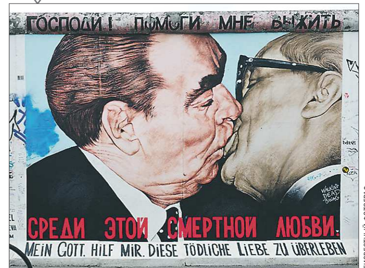
«Поцелуй Брежнева и Хонеккера». Исторический момент изобразил в 1990 году художник Дмитрий Врубель на уцелевшей после падения части Берлинской стены. В 2009 году в рамках реставрации стены рисунок стёрли. Но позже власти всё же разрешили его восстановить, увидеть его в Берлине можно и сегодня