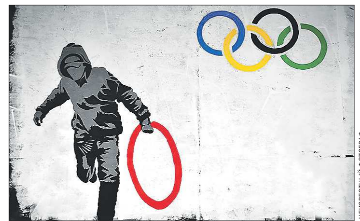
Рисунки Бэнкси (Banksy). Социальные граффити этого англичанина знамениты во всём мире. Его имя и лицо никому не известны, а работы выставляются в музеях и продаются на аукционах. Коллекционеры готовы платить за его рисунки баснословные деньги, одна из работ ушла с молотка за полтора миллиона долларов