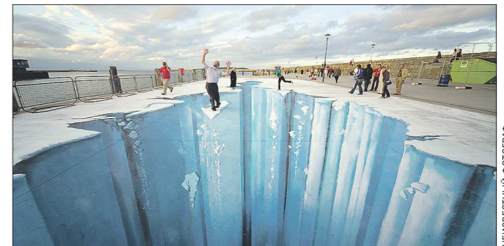
3D-граффити. Один из самых известных художников, работающих в этой технике, — немец Эдгар Моллер. Свои картины он рисует на асфальте и рассчитывает пространство так, что если встать в определённой точке, то рисунок будет казаться объёмным. Например, нарисованная в такой технике пропасть с некоторых углов будет выглядеть абсолютно реальной