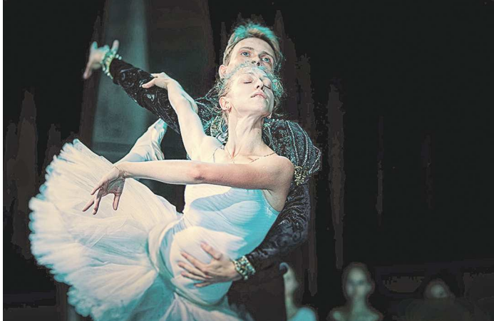
В основе «Лебединого озера» хореография Мариуса Петипа и Льва Иванова. Этой премьерой театр закрывает 103-й сезон

Этот театральный сезон оказался очень насыщенным как на яркие премьеры, так и на призы различных фестивалей. Две «Золотые маски», призы фестиваля малых городов в Дубне, чествование лучших на областном фестивале «Браво!»... По количественным показателям безусловным лидером в нашем рейтинге стал Театр оперы и балета. Ведь две «Золотые маски» нашей области принесла труппа именного этого театра, да и по посещаемости оперный оторвался от ближайшего «преследова-