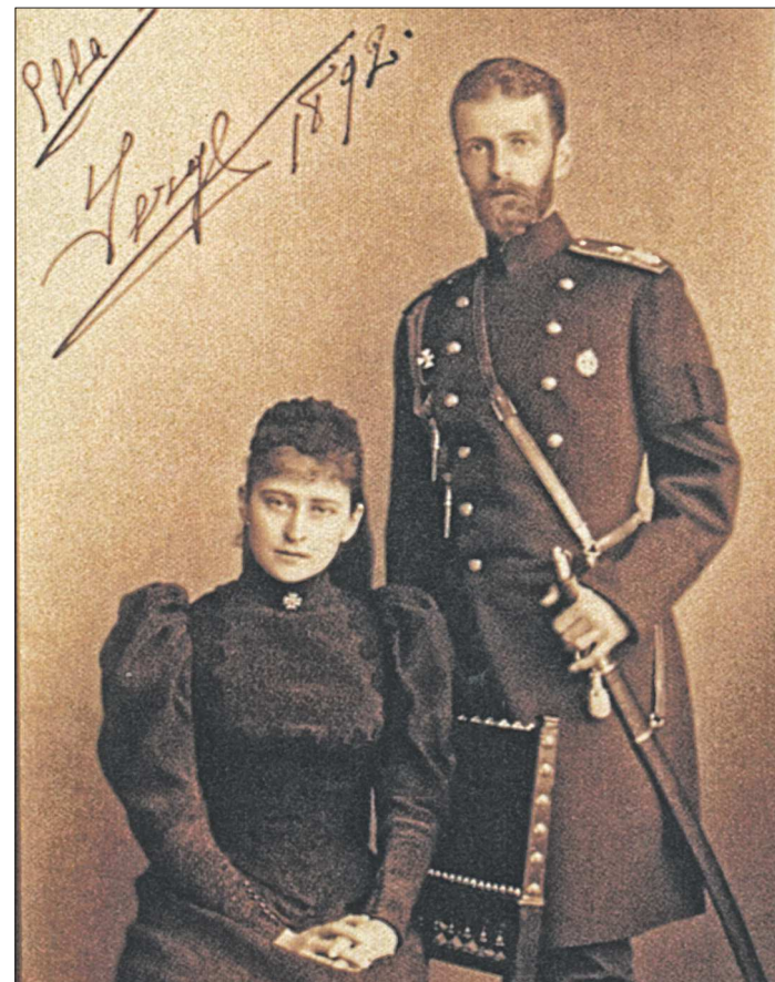
Супруги Елизавета Фёдоровна и Сергей Александрович, который 14 лет был генерал-губернатором Москвы. Убит эсерами-террористами в 1905 году, будучи уже в отставке

В Центре документации общественных организаций Свердловской области хранится уникальный документ (это его официальный статус) — расписка Великих князей и княгини Романовых, а также сопровождавших их лиц о том, что им объявлено и они обязаны быть готовыми 19 мая 1918 года к отправке на вокзал. Из Екатеринбурга путь лежал в Алапаевск.