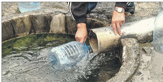
Чтобы обезопасить себя от болезней, врачи советуют обязательно кипятить родниковую воду перед употреблением