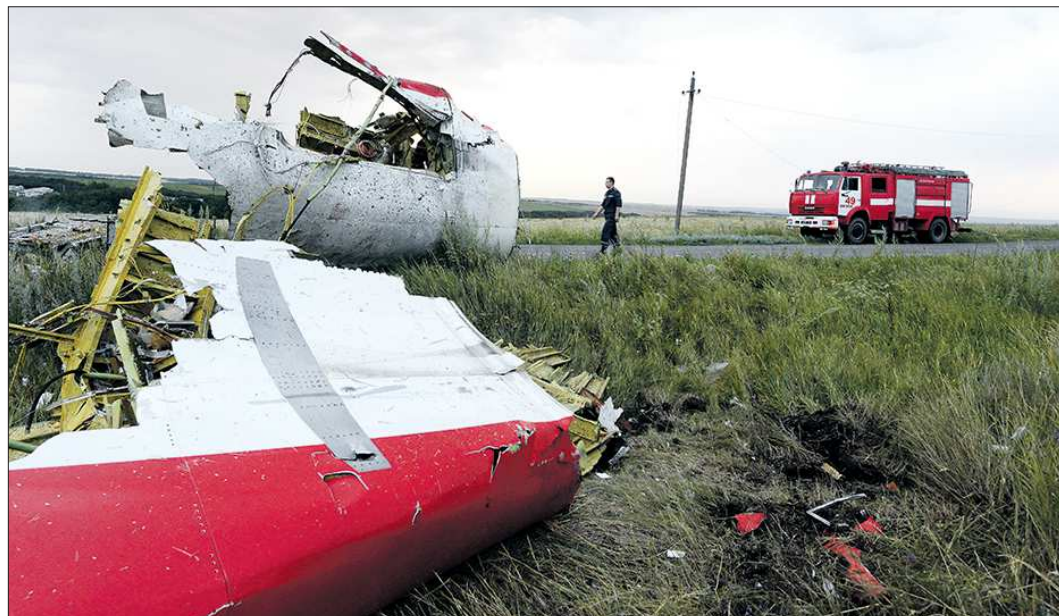
За 12 месяцев работы комиссия по расследованию достоверно установила лишь то, что малайзийский «Боинг» над Украиной был сбит ракетой

17 июля 2014 года пассажирский самолёт «Боинг-777» авиакомпании «Малайзийские авиалинии», выполнявший рейс из Амстердама в Куала-Лумпур, разбился в Донецкой области, унес жизни 283 пассажира и 15 членов экипажа. С того дня прошёл ровно год, а расследование катастрофы, которое ведут западные страны во главе с Нидерландами, до сих пор не завершено. Хотя обычно это занимает не больше трёх месяцев. Причина задержки проста — очень хочется свалить вину на Россию или ДНР, а доказательств этого нет. Никаких.